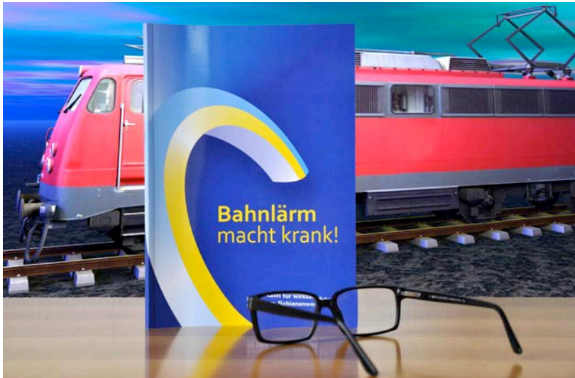
Bild 1: Nachdem Pro-Rheintal und die IG BOHR bereits 2010 den Kongress und das Kompendium „Bahnlärm macht krank“ finanziert haben, wollen die beiden Initiativen mit Hilfe ihrer Unterstützer jetzt auch eine große Gesundheitsstudie für das Rheintal auf den Weg bringen. Das Symposium bildet hierzu den Auftakt.