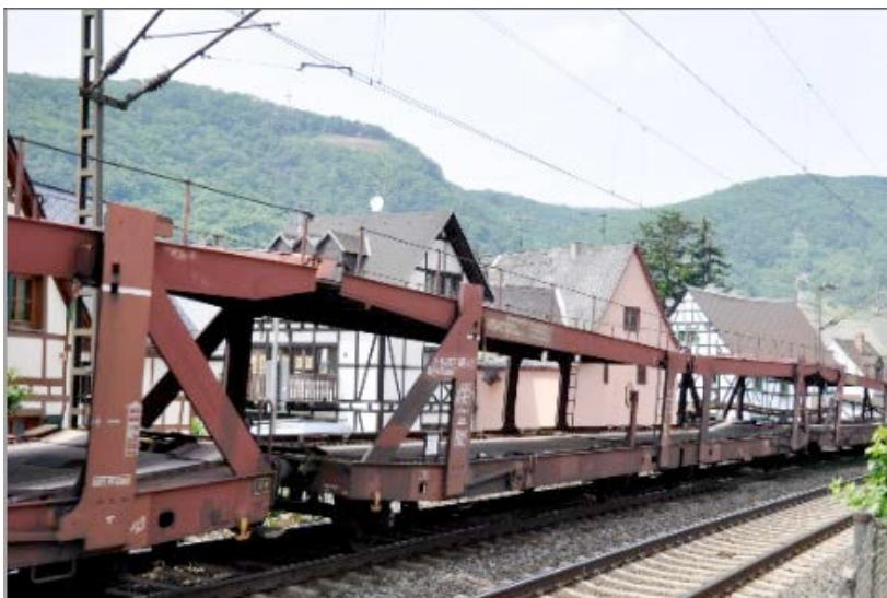
Bild 2: Alte Güterwaggons mit Graugussbremsen und Flachstellen verursachen den größten Teil des Bahnlärms im Rheintal. Sie gehören entweder aufs Abstellgleis oder in die Werkstatt, um überholt und auf die neuen Flüsterbremsen umgerüstet zu werden.